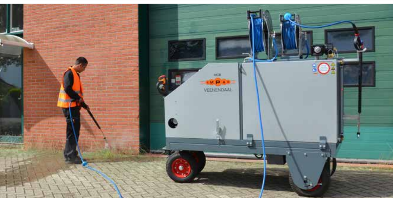
MCB (GAS) OP TRACTIE ONDERSTEL

Vulpomp incl. zuigslang en filter | Hogedruk: tot 150 bar | Tweede veerhaspel met 35 meter slang (t.b.v. het reinigen) | Grotere watertank: 800 of 1000 liter | Afmetingen 800 liter (LxBxH): 212x103x110 | Afmetingen 1000L (LxBxH): 237x103x110 | Tractie onderstel 24V voor maximaal 800 liter (MCB en MCB Gas)