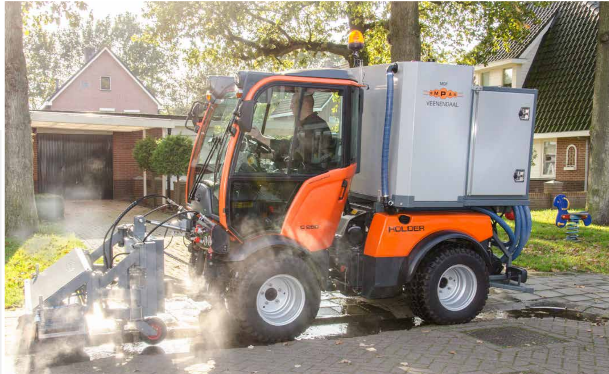
MCP OP HOLDER

De 140 centimeter brede werkbak kan naar links en rechts 25 centimeter uitwijken. Branderketels warmen het water in de MCP op tot een werktemperatuur van 102 °C. Dankzij warmtewisseling is er minder energie nodig voor de opwarming van het water. De maximale druk van de MCP is 120 bar ten behoeve van reiniging.