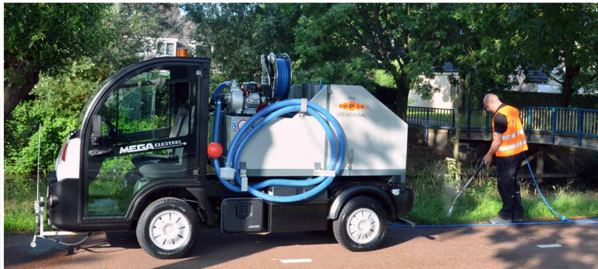
MCB-E OP ELEKTRO-TRUCK

De types MCB verwarmen het water tot 102 °C en werkt voor onkruidbeheer drukloos. De druk voor reiniging is standaard 55 bar, kies voor de optie hogedrukreiniging voor een druk tot 150 bar.