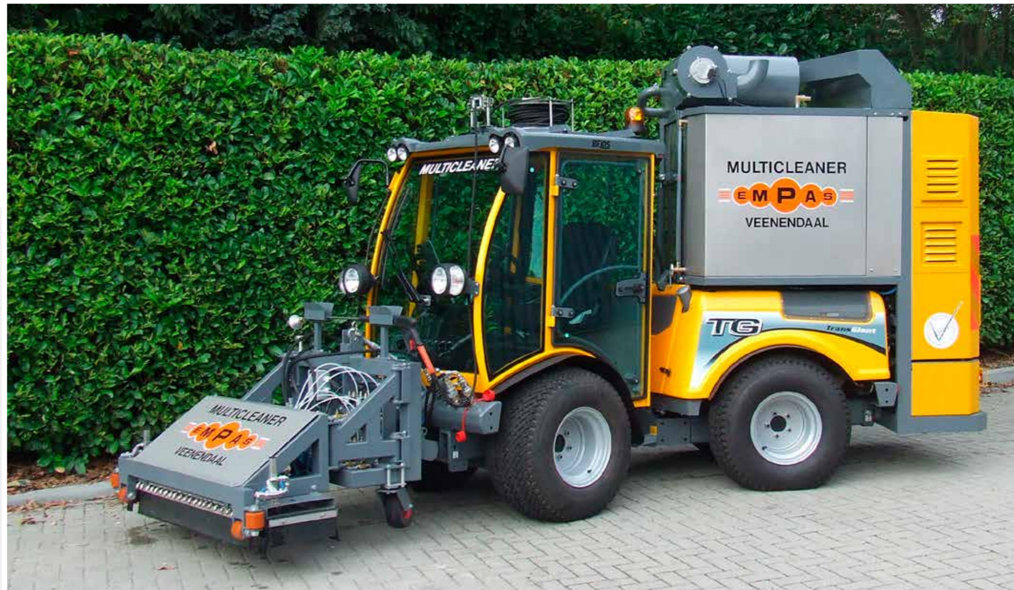
MC OP KÄRCHER MIC84

De unit is zeer solide en verzet het meeste werk op jaarbasis (in vergelijking met andere types). Speciaal voor de moeilijk bereikbare plaatsen is de MC voorzien van een RVS veerhaspel met een werkslang van twintig meter en een werkpistool met lans en vloeikop.